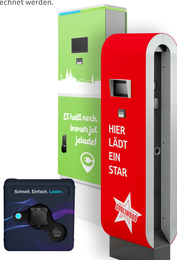
Die smarten Ladesäulen und Wallboxen mit modernster Technologie sind die Aushängeschilder Ihrer Ladeinfrastruktur.

Auch für das Laden Ihrer Firmenwagen eignen sich die Ladestationen optimal. Das Angebot umfasst Ladepunkte in unterschiedlichen Dimensionierungen. Ob im Unternehmen oder zu Hause: Mit dem eMobility-Konzept der SEG kann jeder Standort individuell mit der passenden Lösung ausgestattet und jeder Ladeprozess präzise abgerechnet werden.